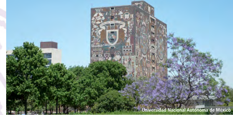
Universidad Nacional Autónoma de México