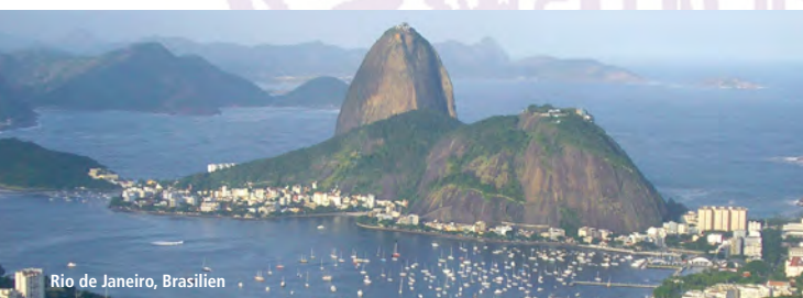
Rio de Janeiro, Brasilien

Die Universität zu Köln bietet zudem einen konsekutiven Master der Regionalstudien Lateinamerika an. Das Masterstudium Regionalstudien Lateinamerika dient der exemplarischen Vertiefung wissenschaftlicher Kenntnisse sowie Sprach- und Kulturkompetenzen. Darüber hinaus trägt es zur persönlichen Profilbildung im Hinblick auf mögliche spätere Berufsfelder bei.