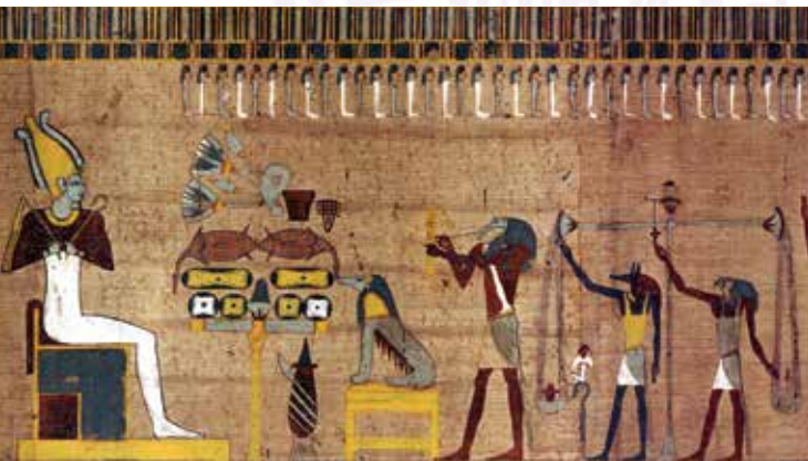
Ägyptischer Papyrus: Totengerichtsszene aus dem Saitischen Totenbuch der Lahtesnacht.